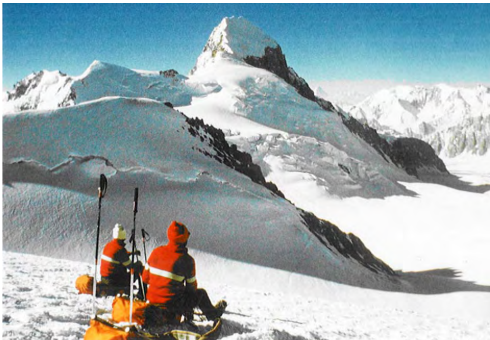
Koh-e Pamir (6320 m) im Wakhan

Roger Senarclens de Grancy (1938-2001) Internationales Gedächtnis Symposium 2011 50 Jahre Erkundungs- und Forschungsarbeiten an der Technischen Universität Graz